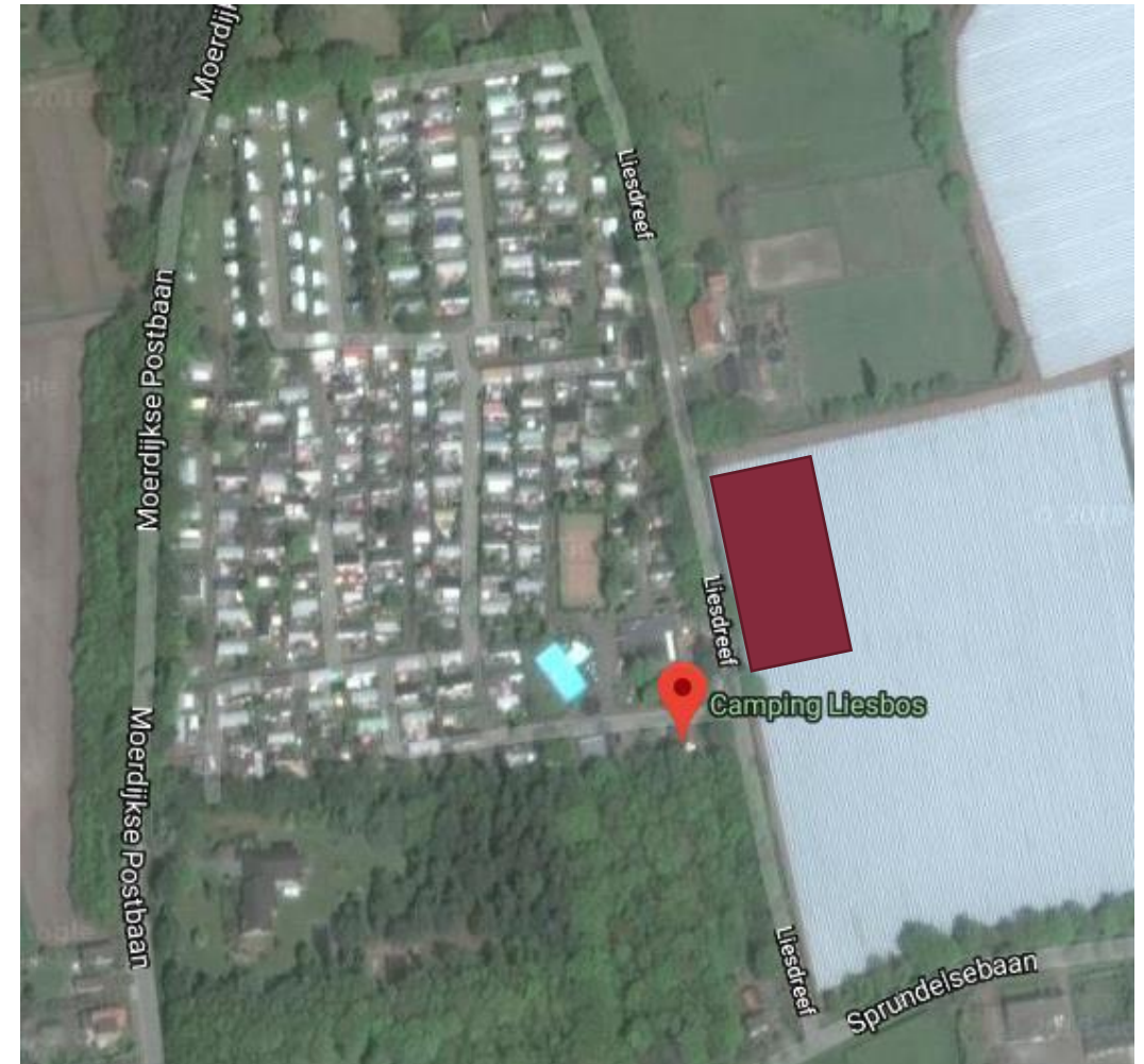
Figuur: Nieuwe ontwikkeling van camping Liesbos